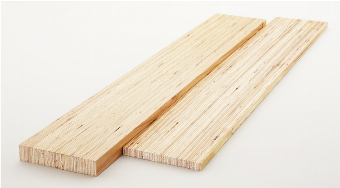
キーラムインテリア® (一般)