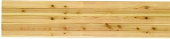
羽目板 ¥41,500/ケース 13枚入り