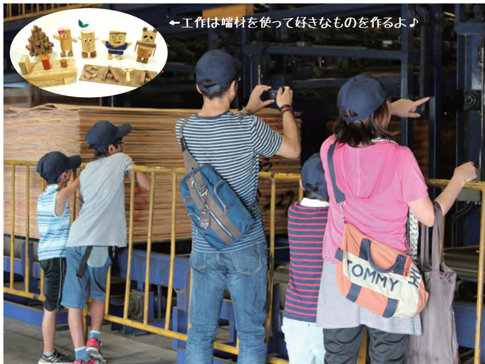
←工作は端材を使って好きなものを作るよ♪

私たちの生活には欠かせない『木材』や『合板』は住宅や家具などたくさん使われています。そんな『合板』がどうやって作られているのか、その目で確かめてみよう！工場見学の後には、合板やLVLの端材を使って工作にチャレンジするよ♪