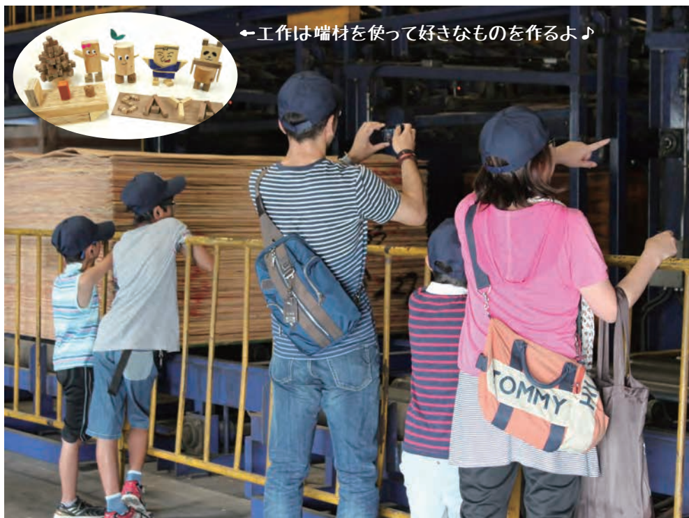
←工作は端材を使って好きなものを作るよ♪

私たちの生活には欠かせない『木材』や『合板』は住宅や家具などにたくさん使われています。そんな『合板』がどうやって作られているのか、その目で確かめてみよう！工場見学の後には、合板やLVLの端材を使って工作にチャレンジするよ♪